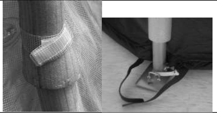
Abbildung 8 und 9

10.) Sie können nun die Boden-Reißverschlüsse schließen.