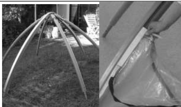
Abbildung 2 und Abbildung 3

3.- 5) Entfalten Sie das Oberteil des Florino XL. Es besteht aus zwei Segmenten einer doppel­lagigen isolierenden Hülle. Führen Sie zunächst das erste Hüllensegment gleichmäßig beidseitig in die Kederleisten ein, die auf den Gerüststangen vormontiert sind. Beginnen Sie jeweils mit der Folienseite, die dem Reißverschluss am nächsten ist. Die Reißverschlüsse der Türen.