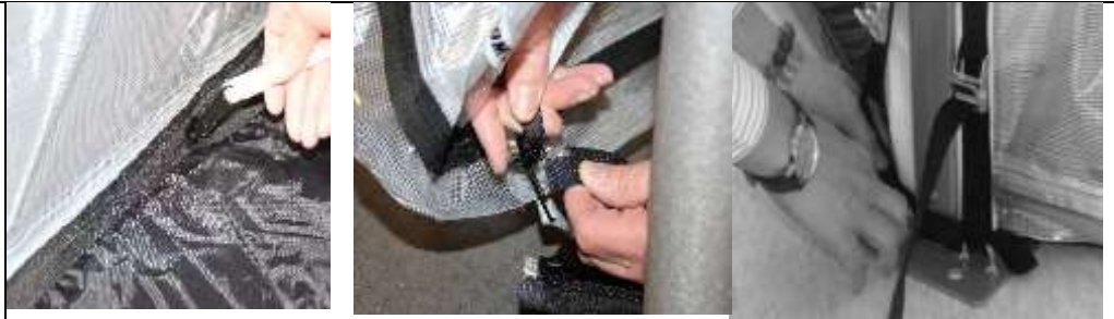
Abbildung 10 und 11

12.) Der Florino ist jetzt bereit, Ihre Kübelpflanzen aufzunehmen.