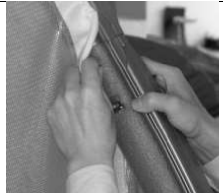
Abbildung 6a bis 6c

7.a) Entfalten Sie das Bodenteil und legen Sie es so auf den Boden, dass der Schlitz mit den Klettverschlüssen zu sehen ist. Klettverschlüsse öffnen. Die Isierelemente nun in das Bodenteil einlegen.